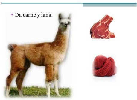
• Da carne y lana.

“Tenemos que reconocer que Bolivia tiene falencia en el sistema reproductivo. La reproducción de camélidos es lenta y si pensamos en la exportación de carne a otros países puede provocar una crisis ya que en tres años se reduciría considerablemente la producción de camélidos. Por eso,